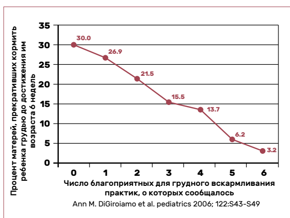
Рисунок 1. Доля женщин, прекративших кормить ребенка грудью до достижения им возраста 6 недель, среди тех, кто начал кормить грудью и намеревался делать это в течение более 2 месяцев, в сопоставлении с числом благоприятных для грудного вскармливания практик, которые были доступны женщинам в медучреждении (43)

Накопленный с того времени опыт реализации инициативы ВФНІ показывает, что для ее успешного осуществления чрезвычайно важно наличие сильного руководства на национальном уровне (в том числе его активное участие и поддержка). Адаптация Инициативы на национальном уровне или на уровне медицинских учреждений, постоянный мониторинг на уровне учреждений, включение ВФНІ в континуум медицинской помощи также оказались очень важными для осуществления инициативы ВФНІ (44).