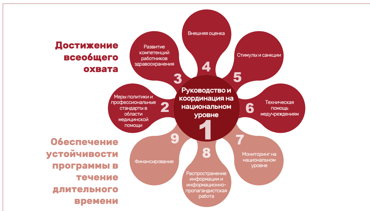
Рисунок 4. Основные обязательства, предусмотренные национальной программой ВФНН